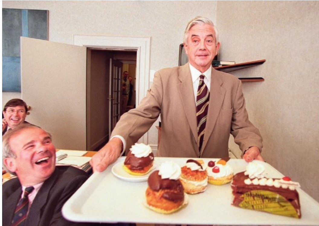
Frits Bolkestein viert het regeerakkoord van 1998 met Frans Weisglas, Henk van Hoof, en taart.